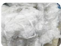
再生プラスチック