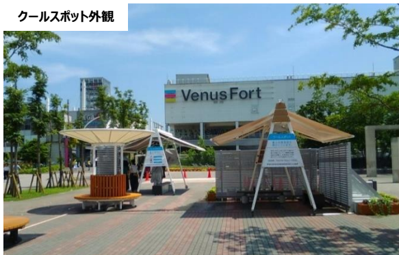
クールスポット外観