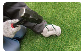
④ 固定 (U字釘などによる固定)

※下地に不陸(凹凸)があると外観を損なうだけでなく、水溜りなどの原因になります。 ※人工芝の下に風が入り込まないようにしてください。強風時にめくれるおそれがあります。 ※コンクリート上への施工の際には接着剤により下地に接着する方法をお薦めします。 詳細については別途弊社までお問い合わせください。 ※施工される際は適切な保護具を着用し、安全に十分注意して作業してください。 ※本製品をカットされる場合は、安全に十分注意して作業してください。