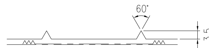
反射体突起部詳細図 S=1/1