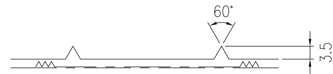
反射体突起部詳細図 S=1/1